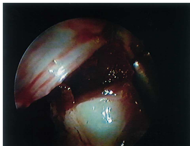
Fig. 3. Miectomía completa. Se ha resecado el rodete y el canal residual se extiende desde el anillo valvular hasta la base de la implantación del músculo papilar.

Un 10-20% de los enfermos con MHO tienen síntomas refractarios al tratamiento médico y son candidatos a la estimulación secuencial auriculoventricular o a la cirugía. Si bien la mejoría clínica y la reducción del GTSVI son mayores con la miectomía que con el tratamiento médico o la estimulación secuencial auriculoventricular 4,5 , es preciso que ello se consiga a costa de una mortalidad operatoria inferior al 3% y con una incidencia de complicaciones anecdótica, para lo cual es imprescindible obtener una óptima exposición del septo interventricular durante la cirugía. Con este fin, hemos empleado el cardioscopio, que permite precisar mejor la anatomía del ventrículo izquierdo, visualizando claramente el septo y las estructuras vecinas (valva anterior mitral, músculos papilares y cuerdas tendinosas). Con ello creemos que se puede realizar una resección, por un lado más segura y más precisa, dado que el cirujano ve en todo momento lo que está rese-