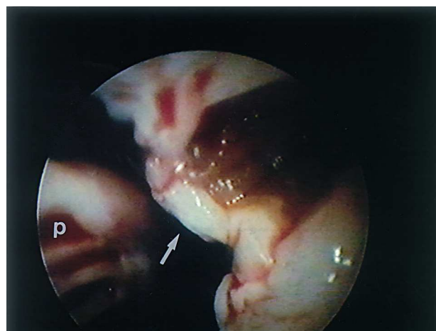
Fig. 2. Miectomía incompleta. Rodete fibromuscular (flecha) sólo visualizable mediante el cardioscopio. Músculo papilar (P).

Tras una adecuada visualización del septo interventricular (fig. 1) y del aparato valvular mitral se realizó la miectomía resecando un fragmento del septo de 4 cm (longitud) × 1 cm (ancho) × 1,5 cm (espesor) (figs. 2 y 3) y la plicatura de la valva anterior de la mitral con 4 puntos de polipropileno de 4-0. A la salida de circulación extracorpórea se comprobó mediante ecocardiografía transesofágica que el GTSVI se había reducido a 15 mmHg, no detectándose insuficiencia mitral, movimiento sistólico anterior ni comunicación interventricular residual. Los tiempos de ischemia y perfusión fueron de 68 y 99 min, respectivamente. La cirugía se concluyó de forma habitual.